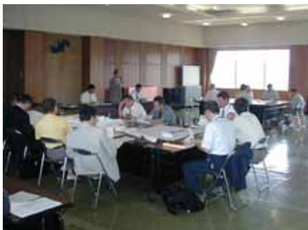
実行委員会の様子

今後、地域の皆様のご意見をお聞きしながら進めていきたいと思いますので、ご理解とご協力をお願いします。