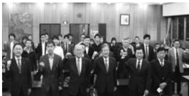
大島会頭、石黒副会頭(中央)と青年経営塾のメンバー

土岐市経済界を担う若手経営者らに自己研鑽の場や相互の交流の場を提供し、資質向上を図る目的として始動した。