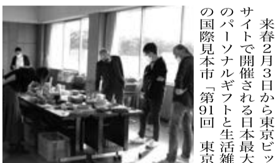
9事業所 19 商品から審査するパイヤーら