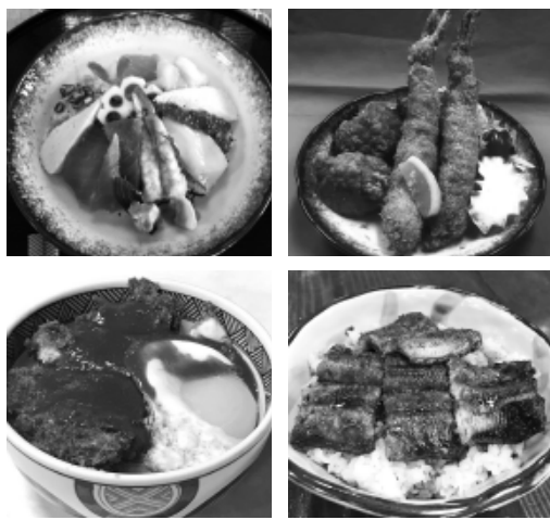
5月からスタートしたプレート(上段)と大好評の丼(下段)

プレート参加店舗 ○泉地区 味信すし、一寸法師、駒寿し(井)、座・じゅう兵衛、美濃寿司(井)、焼肉牛亭土岐店、焼肉食堂はな牛土岐店