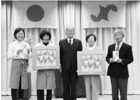
キラリ賞受賞者の「美濃焼おかみ塾」(左)と「土岐市観光ガイドの会」(右)

総会に先立ち、経済界の視点から産業・文化・自然・歴史などの分野で、心豊かに快適で住みよい街づくりに功績のあった個人・法人・団体を表彰する第12回「とき☆キラリ賞」の表彰があり、長年ボランティアガイドとして「おもてなしの心」で活動続ける「土岐市観光ガイドの会」と女性ならではの視点で子ども向けの陶育や美濃焼の魅力を発信する「美濃焼おかみ塾」の2団体に対して大島会頭より和紙工芸作家中嶋正悟さん制作の賞状と副賞が贈られました。