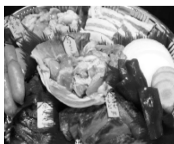
ファミリーセット 4,500円(税込) スモークレスコンロを無料で貸出中!

力を入れているテイクアウトでは、「牛ハラミ&カルビ弁当」や絶品 ハラミやタンなどの生肉がセットにな った「ファミリーセット」また、肉と野菜 が盛り付けられ、お皿ごと持ち帰れる 「1人前用プレート」などお得なメニ ューが揃っていますので、ご自宅でも牛 亭の味をお楽しみください。