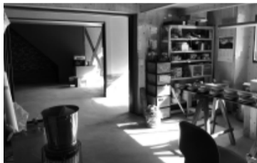
工場一角を陶芸教室に改修