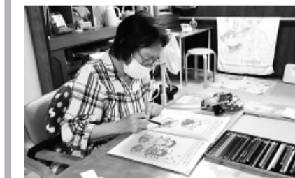
会話をしながらぬり絵を楽しむ利用者さん

施設特徴の一つには、少人数制なので、ニーズに応じ短時間から利用ができ、生活のリズムに合った細かい要望にも対応可能。また、デイサービスと訪問介護を同じ人が担当することで、総合的に信頼関係が生まれ、施設の利用を敬遠されていた方もスムーズに施設へ来る事ができるようになり、「メリハリある一日が過ごせるようになった」と喜ばれている。職員の年齢は30代から70代と幅広く、お子さんと一緒に出勤でき、若い方にも働きやすい環境が整っている。