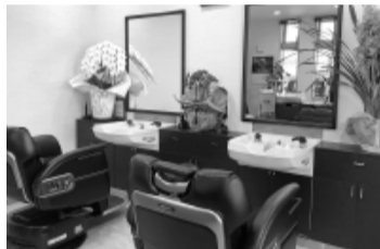
理容椅子とシャンプー台導入