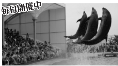
イルカやアシカ、アザラシにタッチできるふれあいイベントも開催中。

知多半島にある南知多ビーチランドは、生き物とのふれあいができる体験型の水族園です。「アシカ・イルカショー」が行われるイルカスタジアムは、プールと観客席の間に柵がなく、イルカのダイナミックなジャンプや、アシカのコミカルなパフォーマンスを目の前で楽しめます。また、伊勢湾や三河湾に生息しているスナメリは、水量1000トンの大水槽でアジやイワシの群れなど近海の魚と一緒に展示