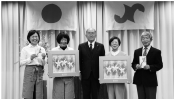
第12回受賞者 美濃焼おかみ塾(左)と土岐市観光ガイドの会(右)