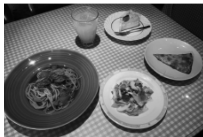
メインが選べるコースランチ1,650円(パスタに前菜、ピザ、デザート、ドリンク付き) 営業時間(昼)11:00~15:00(夜)17:00~22:00 定休日:木曜日

おすすめ料理は、開業以来「牛100%」にこだわり抜いたハンバーグと、20種類の中から選べるパスタ。ランチメニューの中でも人気を集めています。また、以前和食店を営んでいたことから和食料理もあり、「何度行っても飽きない」と評判です。「当店は、経験豊富なコックがいますので、様々な料理をお楽しみ頂けます。コース料理は、予算に応じてアレンジできるので、ぜひご利用ください」と店主の藤原さん。