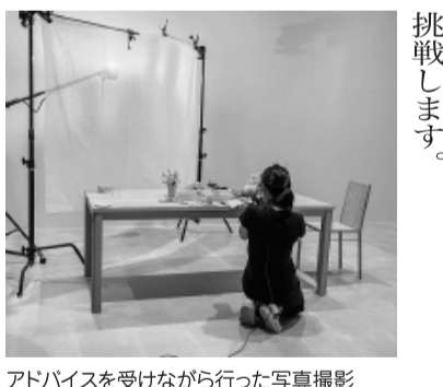
アドバイスを受けながら行った写真撮影

きました。ターゲットの絞り込みをはじめ、商品名や色取りについてご意見を頂き、新商品の開発と並行して弊社の新しいロゴとパッケージ制作にもご協力頂きました。ホームページ制作時には商品撮影の仕方も提案くださり、大変有難い制度と感じました。これからは専門家派遣制度を活用しながら、新しいことに挑戦します。