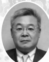
林立 之 立風製陶(株)