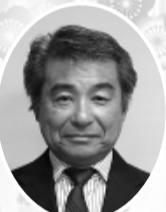
楓 陽光 大東亜窯業(株)