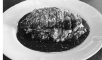
名物の「オムカツライス」(1,050円)

今後はテイクアウトにも力を入れ、補助金を活用して「一目でわかるテイクアウトPR看板」を国道に面した場所に新設予定です。お店でも、お家でも、オムカツライスをはじめこだわりの料理を楽しめるので、是非ご利用ください。