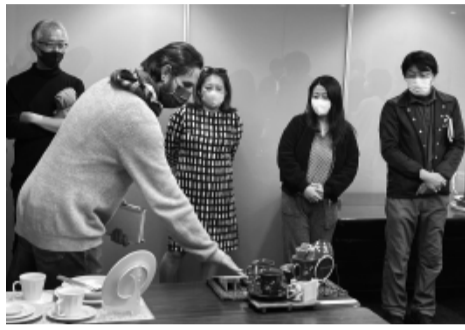
審査員へ商品の説明をする事業者

2月8日〜10日に東京ビッグサイトで開催される「第93回東京インターナショナルギフト・ショー春2022」に土岐商工会議所ブースと「きのいろ」に出展する5事業所が商品選定会にて決定しました。 昨年7月より「新商品企画開発と販路開拓の実践塾」に参加した事業者のうち7事業所がエントリー。新規性・独自性・デザイン性に優れた完成度の高い商品が並び、拮抗する中で決め手となったのが、競合が少ない商品か否かとパッケージの有無でした。 商品選定会後は、審査員を務めたバイヤー、コンサルタント、デザイナー3人との交流会を実施し、応募された事業者から商品の特徴や商品に対する想いを説明してもらい、その後、審査員に良い点や改良点、商品の売り方などを解説してもらいました。参加者からは「バイヤー目線のアドバイスをもらい、大変参考になった」との意見をいただきました。