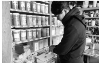
釉薬の調合を行う様子

他にも海外向けの販売体制の構築や、200種類を超える原料を取り扱ってきた経験を活かし陶磁器産地ならではの新たな商品開発に取り組んでいます。