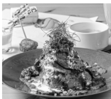
ランチメニューの「国産ローストビーフ丼Set」(限定10食)