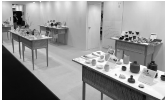
新商品が並ぶ土岐商工会議所ブース『ときのいろ』

日時 5月18日(水) 13時30分～15時40分 会場 セラトピア土岐3階(大会議室) 内容 ①歓迎式典 ②講演会 対象 今春、学校を卒業し市内に就職された方 締切 4月15日(金) ※お問合せ・お申し込みは業務課まで