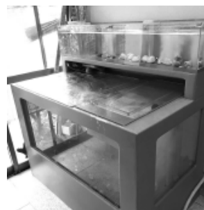
観賞用としてディスプレイ効果もある生簀

コロナ禍により夜の客数が減少。また新鮮な魚介類を県外に仕入れに行くことが困難となったことから、打開策として補助金を活用して「最新型の生簀」の設置を考えました。初めての補助金申請はハードルも高く自分だけではできませんでしたが、商工会議所の支援をいただきながら「事業計画書」を作成しました。以前より大きく、性能の良い生簀を設置したことで、仕入れに行く回数が減り、燃料・人件費などの経費削減。魚介類の鮮度保持向上や観賞用としてのディスプレイ効果もあり、一品料理を追加する方も増え、お客さまの満足度向上に繋がりました。