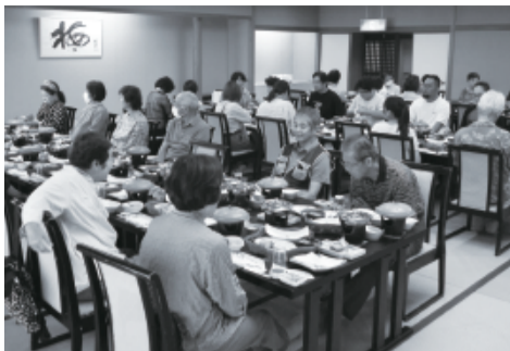
明山荘で昼食の海鮮料理を召しあがる参加者たち