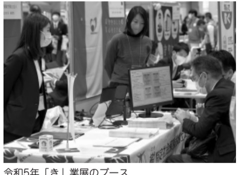
令和5年「き」業展のブース

「き」業展は、岐阜県内・愛知県尾張・三河地方を中心に活力のある企業が一同に集まるビジネスフェアです。今回は100社を超える事業意欲旺盛な企業が出展します。様々な企業の発注したい情報を募集して掲示するBtoBビジネスチャンス掲示板や出展者ブースコンテストなどが開催されます。