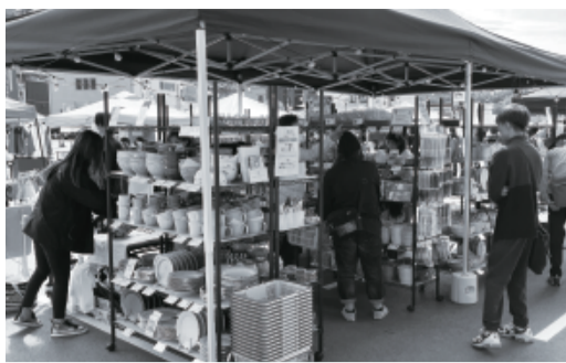
会場内でお気に入りの逸品を探す来場者

土岐市の銘菓・メダカの販売や美濃焼絵付体験、和太鼓演奏、土岐高山城戦国武将隊の演舞などもあり、多くの来場者で賑わいました。2日目は午後からの雨にも関わらず親子連れの方も多くガラガラ抽選会には順番を待つ列がで