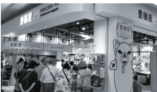
イオンモール豊川内「豊穰屋」を視察する参加者

土岐市商店連合会(事務局・土岐商工会議所)は、9月6日、先進商店街視察を実施し、26名で豊川市を訪問しました。現地では豊川商工会議所の長谷川専務理事、村上相談所長より、豊川市での地域振興