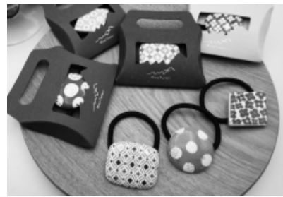
「mino fuwari」第一弾 美濃焼ヘアゴムとパッケージ