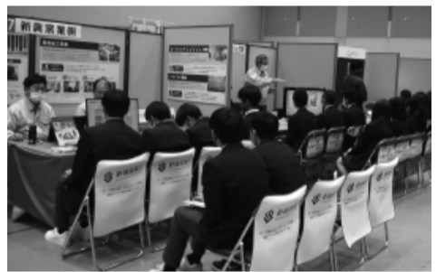
令和5年度合同企業説明会の様子

今後、商工会議所では大卒・中途採用等の人材確保に向けた事業についても検討していきます。