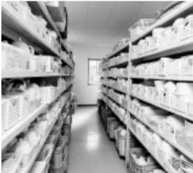
新しい事務所に設けられた製品のサンプル室

(株)宮川商会は昭和46年に創業、陶器卸業として美濃焼の企画・販売をスタートしました。平成3年からはガラス製品の取扱いも始め、事務所には美濃焼やガラス製品の技術資料や製品のサンプル室も完備されています。また、自社オリジナルカタログとWEBサイトを作成し、全国の事業者へ発信しています。