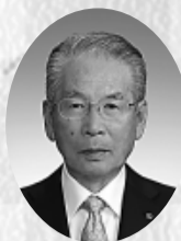
玉樹成三 丸利玉樹利喜蔵商店