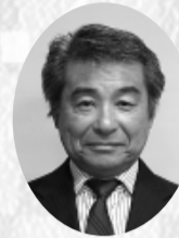
楓 陽光 大東亜窯業(株)