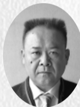
林 大輔 協業)肥田セラム