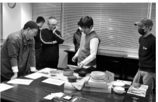
バイヤーからアドバイスを受ける事業者

ブースにお立ち寄りください。ギフト・ショー出展の様子などは3月号にてご報告します。 ギフト・ショー出展者 ・ 金正陶器(株)(泉町) ・ (株)伸光窯(泉町) ・ 立風製陶(株)(下石町) ・ (有)丸達製陶所(駄知町) ・ (株)ROKUROWORKS(泉町)