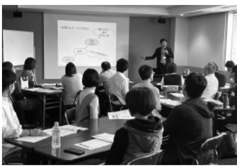
令和5年度の創業塾で講義を受ける参加者